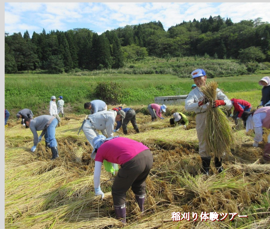
稲刈り体験ツアー