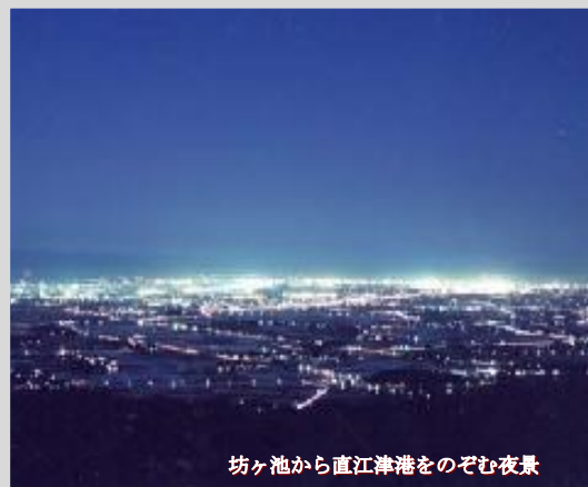
坊ヶ池から直江津港をのぞむ夜景