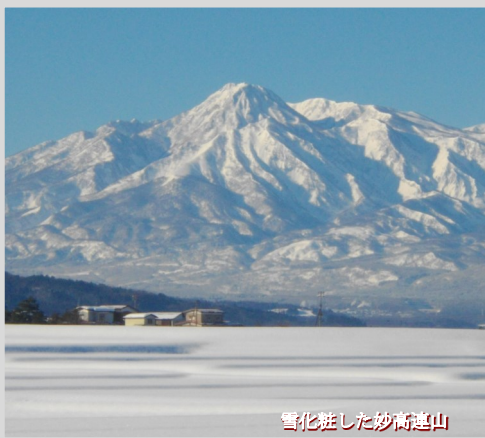
雪化粧した妙高連山