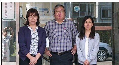
櫛池農業振興会の職員

雪が降ったらどうしよう…、具合が悪くなったらどうしよう…、人間関係でトラブル発生…等々、困った時は地域の皆さんで優しくサポートしますので、気軽に話しかけてください！