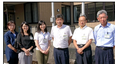
清里区総合事務所はじめ市職員