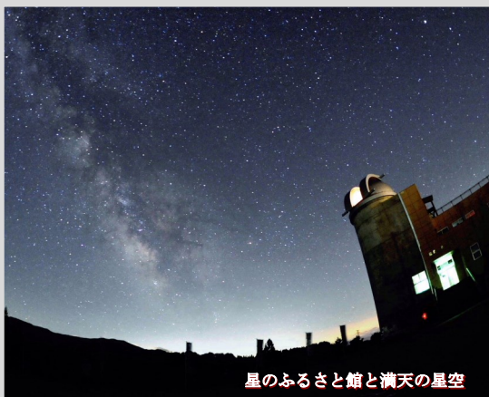
星のふるさと館と満天の星空