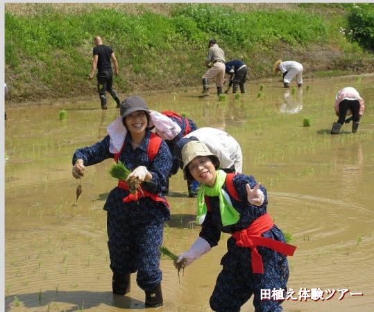
田植え体験ツアー