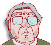
檜池農業振興会 平田事務局長からひとこと

檜池地区は高齢者が多い地域ですので、除雪体制の整備・実用化、高齢者の通院・買い物の移手段の確保などが急務となっています。任期中は檜池農業振興会に席を置きながら活動していただきます。私を含め3人の職員が業務から日常生活までサポートしますし、営農組織や地域の方も良くしてくださいませので、安心していらしてくださいね。