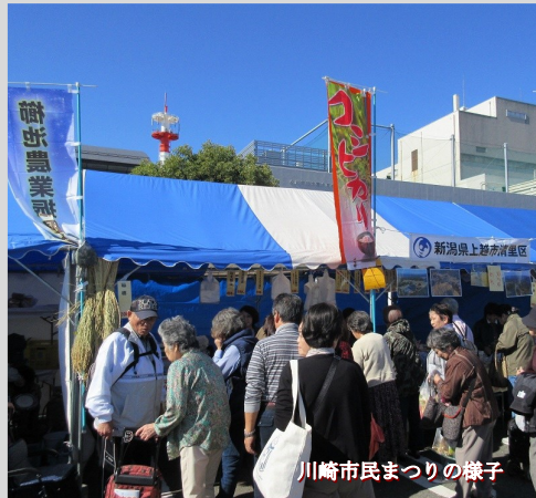
川崎市民まつりの様子